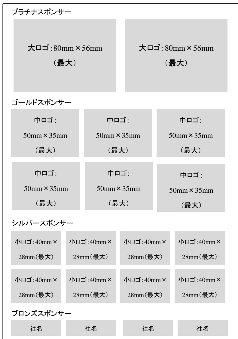
図 1 配付資料 (A4 サイズ) のロゴ掲載イメージ