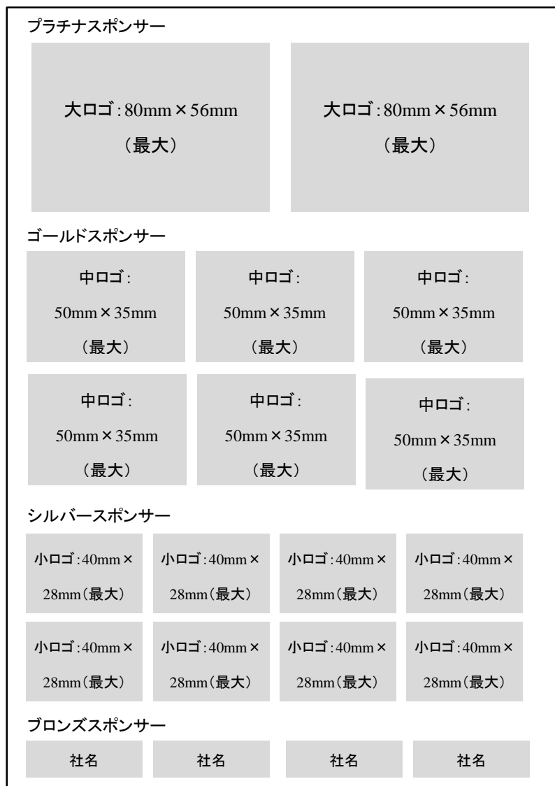
図 1 配付資料 (A4 サイズ) のロゴ掲載イメージ